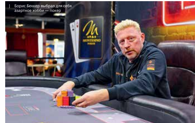
Борис Беккер выбрал для себя азартное хобби — покер

Еще один олимпийский чемпион и двукратный победитель турниров «Большого шлема» россиянин Евгений Кафельников был замечен в увлечении азартными играми. Правда, грешил он этим еще во время своей спортивной карьеры. Нередко в заметках о проигранных матчах встречались комментарии в духе: «А не сказался ли на сегодняшней игре спортсмена утренний поход в местное казино?» К слову, он не раз выигрывал турниры по спортивному покеру в России и Европе. Но в 2009 году в одном интервью Евгений осудил спортивный покер и сказал, что сам вскоре бросит это азартное дело: «А по сути покер — азартная игра, которая затягивает не меньше остальных. И она, поверьте,