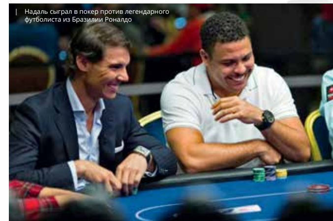
Надаль сыграл в покер против легендарного футболиста из Бразилии Роналдо

В 2014 году Надаль сыграл в покер против легендарного футболиста из Бразилии Роналдо. Спрашивается, зачем вообще было проводить этот публичный карточный поединок? Ну все-таки они являются очень видными личностями, известными во всем мире,