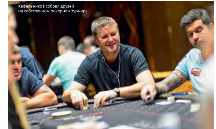
Кафельников собрал друзей на собственном покерном турнире

способна довести человека „до ручки“. Все турниры по спортивному покеру — коммерческие. Азарта в них столько же, сколько и в казино. Будь по-моему, я бы и спортивные [покерные] клубы закрыл. Надеюсь, когда-нибудь наше правительство и депутаты сделают и этот шаг». Но в 2017-м Кафельников собрал друзей на собственном покерном турнире.