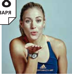
30 ЛЕТ ИСПОЛНИЛОСЬ АНЖЕЛИКЕ КЕРБЕР

На пятнадцатом году профессиональной карьеры немка с польскими корнями может подвести промежуточный итог, который ставит ее в ряд самых заметных теннисисток последнего десятилетия. Экс-прима мирового женского тенниса, в 2016 году победившая на двух «Шлемах» (в Австралии и США) и сменившая на теннисном троне Серену Уильямс, более года не знала турнирных побед, безуспешно пытаясь обрести уверенность и былую игровую форму. Только в начале нынешнего сезона, накануне Australian Open, Кербер праздновала успех на «разогревочном» турнире в Сиднее, выбив из борьбы в том числе пятую ракетку мира Винус Уильямс и победив в финале австралийку Эшли Барти. Это был одиннадцатый одиночный титул в карьере немки. Запомнилась ее игра в Перте — на