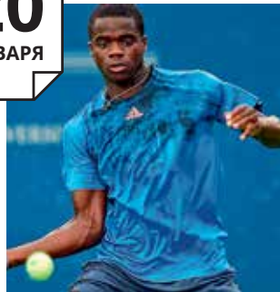
СВОЙ 20-Й ДЕНЬ РОЖДЕНИЯ ОТМЕТИЛ ФРЭНСИС ТИАФО

На вопрос «Кто такой Фрэнсис Тиафо?» лучше всех ответил Роджер Федерер: «Этот парень, возможно, лучший из молодых американцев». Именно Тиафо заставил швейцарца на прошлогоднем US Open изрядно поработать, прежде чем Роджер поставил победную точку в затычном и весьма непростом пятисетовом поединке. После поражения в первом круге тинейджер родом из Сьерра-Леоне не скрывал счастливых слез: «Я смотрел US Open еще маленьким ребенком и мечтал когда-нибудь сыграть на этом корте против грандов. И вот этот день настал, и, кажется, я никого не разочаровал!» Кстати, незадолго до нью-йоркского «Шлема» Тиафо наделал шума, выиграв в Цинциннати у фаворита турнира — молодого немца Александра Зверева.