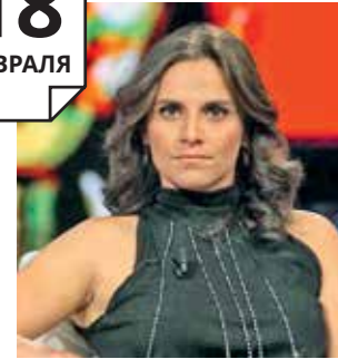
35 ЛЕТ ИСПОЛНЯЕТСЯ РОБЕРТЕ ВИНЧИ

Маленькая (рост 163 см) улыбчивая итальянка — одна из самых больших тружениц профессионального Тура: за восемнадцатилетнюю карьеру она собрала календарный «Шлем», вместе со своей партнершей Сарой Эррани выиграв все четыре «мэйджора» в парном разряде. Кстати, дуэт Винчи/Эррани — всего лишь пятая пара в истории тенниса, которой покорился этот символический рубеж. На протяжении почти трех лет итальянка удерживала звание первой ракетки мира в парном разряде.