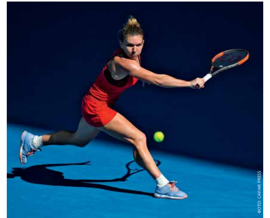
Уступив в финале датчанке Возняцки, румынка Симона Халеп упустила возможность выиграть первый в карьере «мэйджор», а заодно и рассталась со званием первой ракетки мира

Луч надежды для нас забрезжил в концовке второй партии, когда Рублёв, уступая 2/4, сумел взять четыре гейма подряд. Более того, в третьем сете россиянин уже сам повел со счетом 4/2, но преимущества своего не удержал и через 3 часа 4 минуты после начала матча был вынужден признать свое поражение (3/6, 6/4, 4/6, 4/6). Наверное, эта неудача не менее