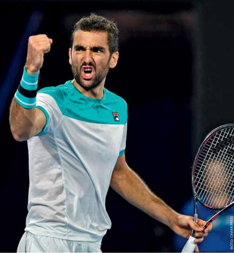
Марин Чилич очень хотел выиграть свой второй «Шлем», но у соперника из Швейцарии были на этот счет другие планы

Изменив из-за травмы технику подачи и усилив свою тренерскую команду тридцатидевятилетним чехом Радеком Штепанеком, который с конца ноября работает с ним вместе с Андре Агасси, серб, однако, перед началом выступления в Мельбурне не успел получить хотя бы минимальную игровую практику. В итоге Чон Хён, обыгравший перед этим Александра Зверева, пусть и в упорной борьбе, но победил (7/6 (7:5), 7/5, 7/6 (7:3)). А прежде чем сняться из-за сильнейших мозолей в полуфинале против Роджера Федерера, обыграл еще и Тенниса Сандгрена.